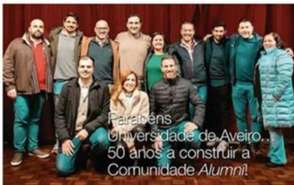
ASSOCIAÇÃO DE ANTIQUINHO DA UA

Neste âmbito procurou-se, para além da utilização dos meios de comunicação institucional, aproveitando-se o site da própria Universidade, onde a AAAUA tem uma página disponível, bem assim como a página na revista LINHAS, onde se produziram dois artigos, edições 40 e 41, respetivamente divulgadas em junho e em dezembro.